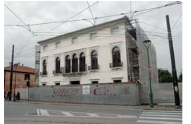
Pericolante La villa era imballata da anni per il consolidamento