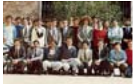
Classe Terza liceo dell'83

VENEZIA — Si sono «maturati» 30 anni fa, da allora non si sono mai persi di vista, caso raro per gli ex compagni di liceo e l'11 maggio prossimo celebreranno il trentennale dalla maturità con l'annuale cena di classe. Si tratta degli ex allievi della terza liceo 1983 del classico Cavanis, una «superclasse» di 33 studenti (più uno, che all'ultimo anno aveva scelto il Marco Polo ma resta di diritto del gruppo). Da allora, ogni anno, la terza liceo '83 si è ritrovata per festeggiare l'amicizia nata sui banchi. Prendendo a prestito le nozioni di Educazione civica è stata fondata una pseudo-associazione, con Corpus Iuris di 249 articoli - non molto rispettato - e viene così convocata «l'Assemblea di classe». I compagni dell'83 sono sparsi per il mondo: professionisti, medici, avvocati, ricercatori universitari, giornalisti, imprenditori, pubblici ufficiali, politici anche. L'11 maggio l'appuntamento è al «Paradiso perduto».