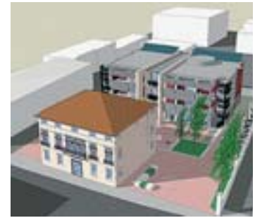
Il piano Palazzo e piazza nel retro

Il restauro della villa, vincolata dalla Soprintendenza, è solo un pezzo dell'operazione prevista in quella zona. Sul retro dell'edificio antico, infatti, verrà costruito un edificio con case, negozi e il garage sotterraneo. Al centro una piazza nuova. «Il piano di recupero approvato prevede due interventi diversi - spiega Sabbadin - da un lato il restauro della villa, che poi verrà adibita ad uffici chiedendone però l'uso unitario e potrebbe ospitare, per essere concreti, la sede della direzione di qualche ente, dall'altro la piazzetta e il fabbricato. Siamo pronti, attendiamo solo il via libera del Comune di Venezia per cominciare».